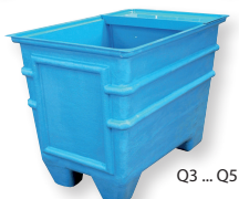
Q3 ... Q5